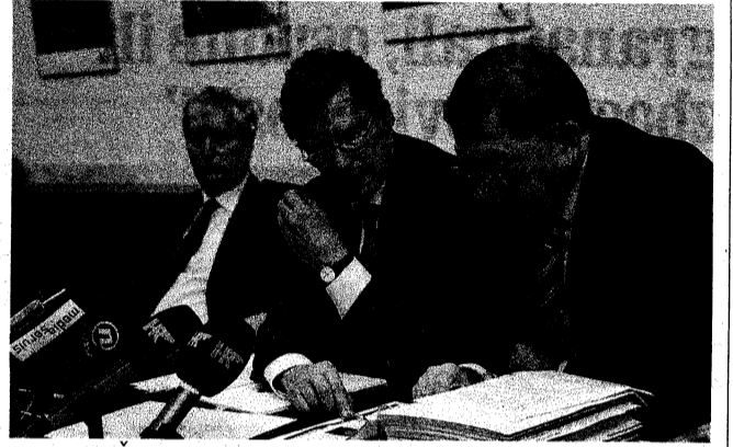
Krunoslav Šams, oko čijeg se imenovanja podigla prašina

● Poznajete li vi nekoga tko je ostao bez posla? - Kako ne, većina mojih rodaka u Dalmaciji je bez posla. Ja im, kao predsjednik Vlade, ne mogu izravno dati posao jer ne funkcioniram na taj način. U pravilu, najteže je u pronalaganju posla onima s nižim obrazovanjem, ali i mladima koji traže prvi posao. ● Hrvatska je prije krize imala oko 230.000 nezaposlenih. Hoće li se taj broj popesti na 400.000? - Ne bih se upuštao u prognoze te vrste. Mislimo da se u ovoj godini neće dogoditi, da će infrastrukturni zahvati pomoći građevinskom sektoru a da će slijedeća godina biti bolja. ● Poznajete li nekoga iz SDP-a bez posla? - Poznajem mnogo SDP-ovaca bez posla. Neki i pitaju gdje smo mi jervide stranku kao izvor posla. Pitaju -gdje su naši? Naši su na vrhu piramide, tamo gdje se preuzima odgovornost upravljanja nekim složenim sustavima. Ali, sve ostalo nema veze sa strankom. Mi smo drukčiji, nismo HDZ. Kada se postavljaju direktori, ako imamo odgovarajuće stručne i sposobne ljude u stranci, onda ćemo ih imenovati, ali ako ih nemamo onda će to biti oni koji nemaju veze sa strankom ali su stručni. Jer naša je odgovornost. Tako je i u slučaju Zračne luke Zagreb. Ako je odgovornost naša, onda i osobe koje se predlažu nose tu odgovornost. Ne može biti jasnije i transparentnije. I u najmanju je ruku potpuno promašeno nazvati uhljebljenjem prelazak Krunoslava Šamsa, nesranačkog načelnika Sektora u ministarstvu pomorstva,